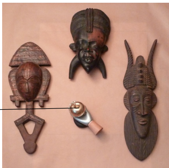
une pomme d'or dans une main d'argent veillée par des masques et reliquaire Africains